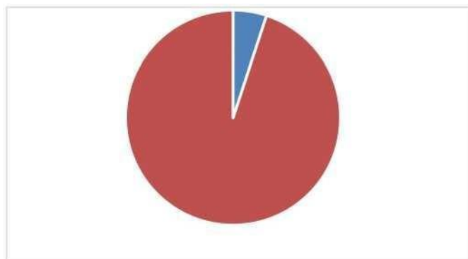
图 2：支出决算构成情况（按支出性质）

本单位 2022 年度支出合计 8555.636995万元，其中：基本支出 713.746183万元，占 8.34%；项目支出7841.890812万元，占 96.65%。